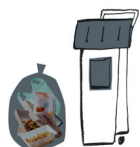
Ordures ménagères toutes les semaines