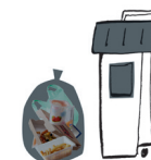
Ordures ménagères toutes les semaines