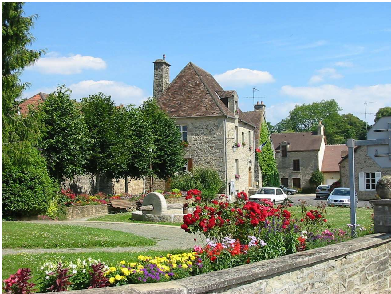
Commune de Lonrai