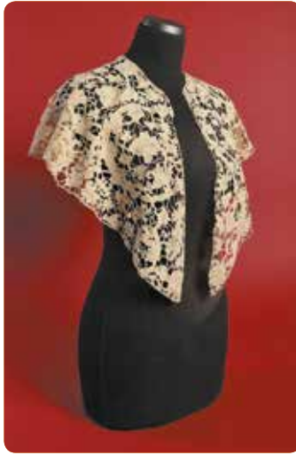
Col, dentelle à l'aiguille, Point plat de Venise, lin, seconde moitié du XVII e siècle, prêt Ville d'Argentan