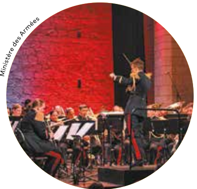
Ministère des Armées

Le samedi 12 avril à 20 h 30 , le théâtre d'Alençon accueillera la Musique des Troupes de Marine et la Chorale Résonance 61 pour un concert co-organisé par la Ville d'Alençon et la délégation militaire départementale.